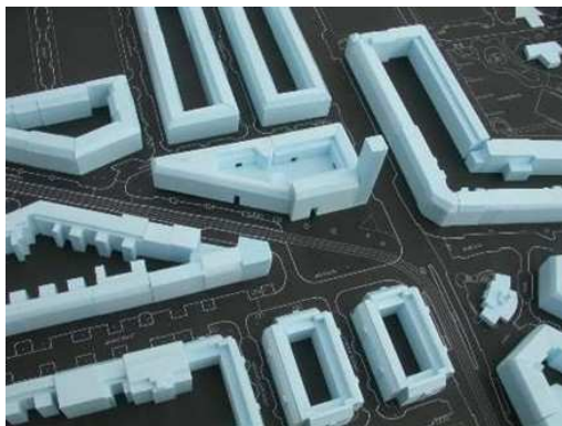
Voorbeeld: Maquette Javaplein, Indische Buurt

Maak een eenvoudige maquette van de locatie op schaal 1:500. De onderlegger is een kaart gelijmd op stevig (golf)karton, waarop de mogelijke ontwerplocatie dmv een gekleurde lijn zijn omrand. De bebouwing is van een kleur piepschuim en erop vastgelijmd, schat daarbij de hoogtes van de gebouwen ongeveer in.